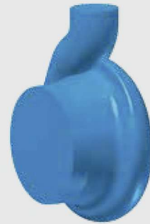
Carcaça patenteada em espiral axial